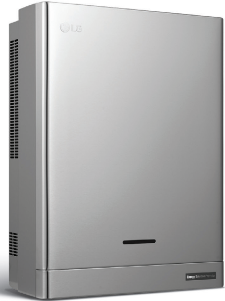
PCS (D008KE1N211) (D010KE1N211)

System Monitoring ermöglicht erhöhten PV-Eigenverbrauch für mehr Unabhängigkeit. Kompatibilität mit LG-Wärmepumpe Mono-Bloc