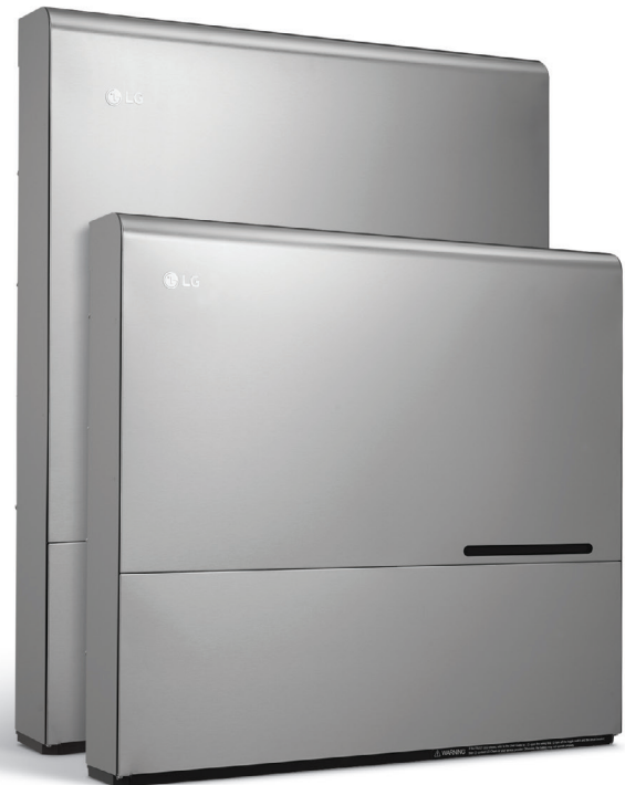
Batterie (BLGRESU7H) (BLGRESU10H)